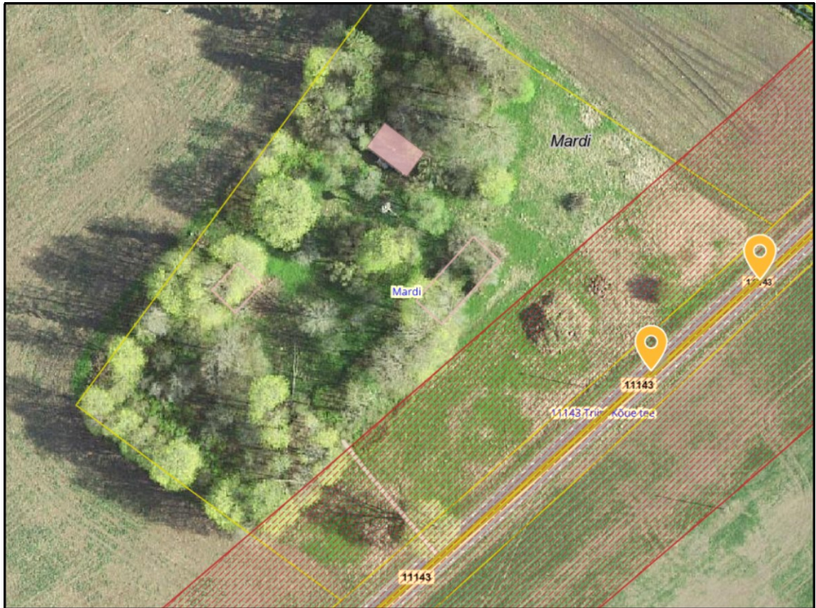
Joonis 1. Ristumiskoha asukoha vahemik tähistatud oranžide tingmärkidega